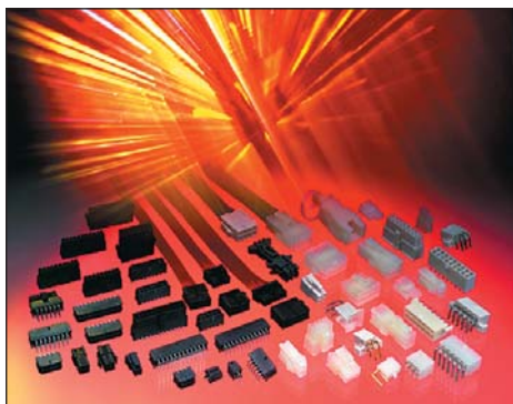
Рис. 5. Семейства силовых коннекторов Mini-Fit Jr. и Micro-Fit 3.0

Micro-Fit 3.0 (рис. 5) — компактная патентованная система силовых коннекторов с шагом 3,00 мм и токами до 5 А на контакт. Благодаря специальному материалу контактов и наличию вариантов с золотым покрытием может использоваться как для силовых, так и для сигнальных цепей. Широчайшая гамма одно- (от 2 до 12 контактов) и двухрядных (от 2 до 24 контактов) вариантов розеток и вилок как на провод, так и на плату (Molex — единственная компания, выпускающая розетки на плату). Варианты как для пайки вручну/волной, так и для поверхностного монтажа. Имеется версия ВМI — для «слепого» сочленения. Также Molex предлагает стандартные кабели питания с розетками Micro-Fit 3.0, залитыми пластиком (overmold).