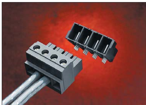
Рис. 2. EuroMax: разъемный клеммный блок