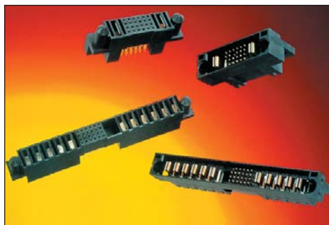
Рис. 3. Power Dock: семейство гибридных межплатных коннекторов