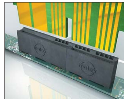
Рис. 4. Power Edge: семейство гибридных межплатных коннекторов