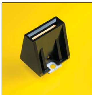
Рис. 1. Bus Bar Connector

Mini-Fit Jr. (рис. 5) — патентованная система силовых коннекторов Molex, впервые получившая широкое распространение в компьютерах с материнской платой стандарта АТХ. Широчайшая гамма вариантов вилок и розеток: BMI («слепое» сочленение), CPI (вилки под запрессовку), IDT (розетки на кабель с IDT-терминацией провода), TPA (розетки с вторичным замком для фиксации контактов). Стандартный вариант рассчитан на 9 А на контакт, вариант HCS — на 12 А. Завершается разработка герметичной системы H2O со степенью герметизации IP67 и токами до 9 А на контакт. Серия будет включать как розетки на кабель, так и вертикальные и угловые вилки на плату.