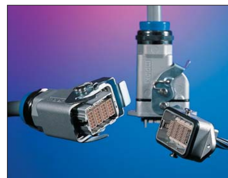
Рис. 9. Mini-HMC: система герметичных (IP65) коннекторов для робототехники и производства оборудования в литых алюминиевых корпусах

Система MX150L может применяться как в автомобилестроении, так и в смежных областях: non-automotive transportation (тракторы, погрузчики, автобусы), производстве инструментов и оборудования.