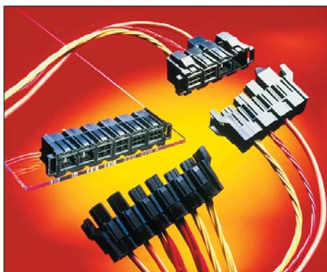
Рис. 6. Семейство коннекторов Comprode

Micro-Fit 3.0 (рис. 5) — компактная патентованная система силовых коннекторов с шагом 3,00 мм и токами до 5 А на контакт. Благодаря специальному материалу контактов и наличию вариантов с золотым покрытием может использоваться как для силовых, так и для сигнальных цепей. Широчайшая гамма одно- (от 2 до 12 контактов) и двухрядных (от 2 до 24 контактов) вариантов розеток и вилок как на провод, так и на плату (Molex — единственная компания, выпускающая розетки на плату). Варианты как для пайки вручну/волной, так и для поверхностного монтажа. Имеется версия ВМI — для «слепого» сочленения. Также Molex предлагает стандартные кабели питания с розетками Micro-Fit 3.0, залитыми пластиком (overmold).