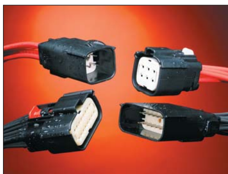
Рис. 8. MX150L: система герметичных (IP67) коннекторов

MX150L (рис. 8) — система герметичных (IP67) коннекторов, рассчитанных на токи от 18 до 40 А на контакт. Включает розетки на кабель, вилки на кабель с вариантом крепления на панель (4 варианта), угловые и прямые вил-